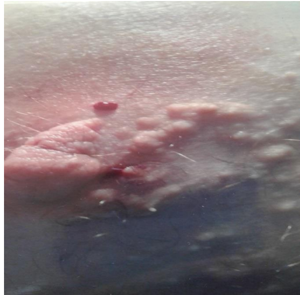
Figura 2. Nevo lipomatoso cutáneo superficial.