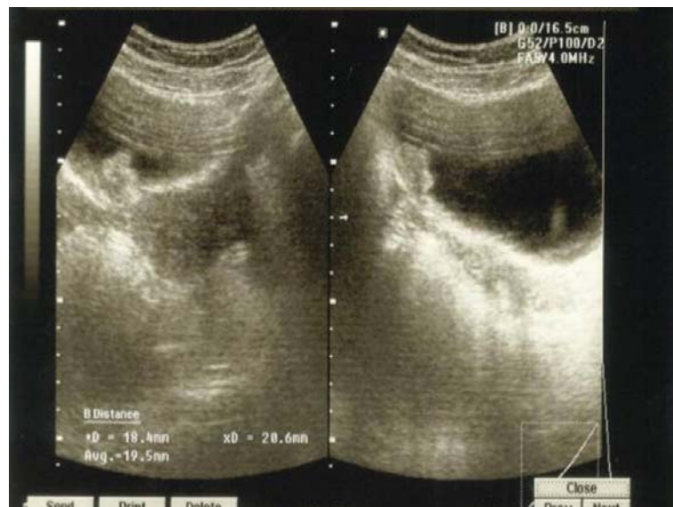
Fig. 2. Cortes coronal y sagital, donde se visualiza imagen ecogénica posterolateral derecha que mide 18 x 20 mm, con crecimiento endoluminal y base ancha.