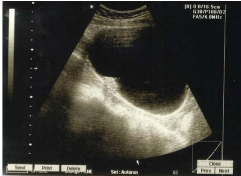
Fig.1. Imagen ecogénica posterolateral derecha dependiente de la pared.

Ultrasonido vesical: Imagen ecogénica posterolateral derecha dependiente de la pared (Figura 1) que mide 18 x 20 mm, e impresiona interrumpir su continuidad con crecimiento endoluminal y base ancha de posible causa neoformativa (Figura 2).