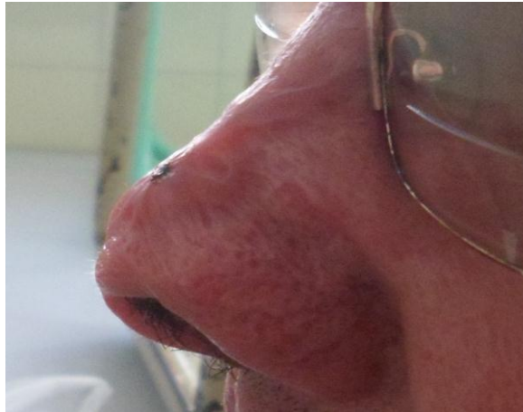
Figura 5. Resultado estético a los 50 días del postoperatorio.