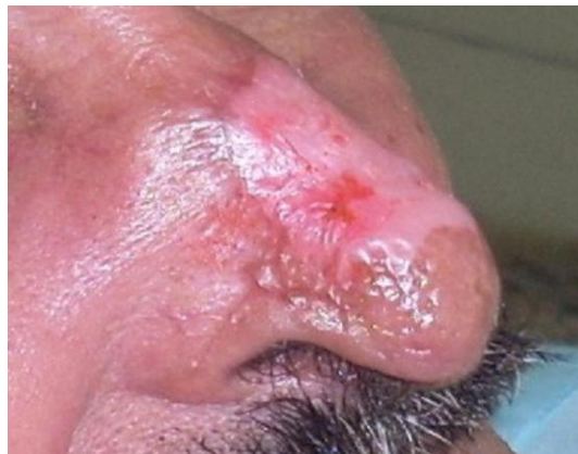
Figura 2. Tres meses de postoperatorio. Obsérvese el área de despigmentación en dorso nasal.