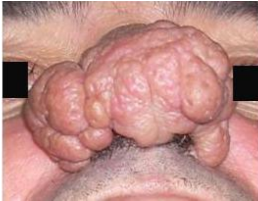
Figura 1. Rinofima severo que provoca obliteración de las narinas.